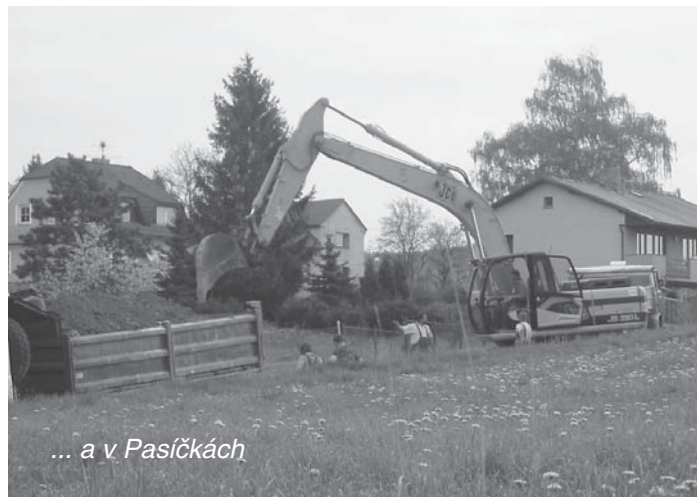
... a v Pasíčkách