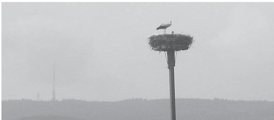
Letos se čápi vrátili na hnízdo ve Křemži v neděli 17. dubna.