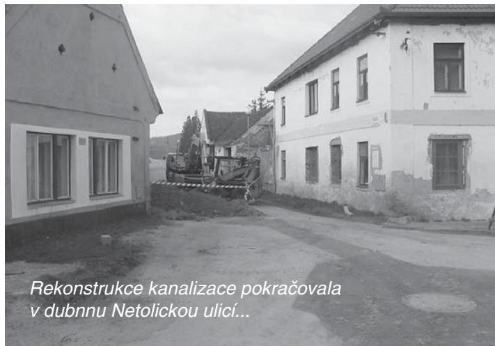
Rekonstrukce kanalizace pokračovala v dubnu Netolickou ulicí...