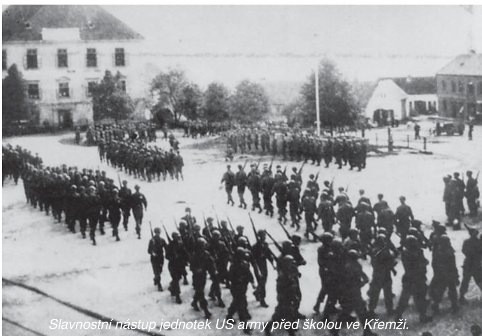
Slavnostní nástup jednotek US army před školou ve Křemži.

Konec války byl ohlášen v sobotu 5. května 1945. Pražský rozhlas radostně ohlásil, že je třeba se vypořádat s okupanty a Praha volá o pomoc. Křemže byla také vzhůru. Škola byla osídlena 50 vojáky Wehrmachtu se zbraněmi. V té době mnoho učitelů, profesori a jiní pracovníci budovali dráhu od Kráků ke Mříčí na dopravu niklové rudy. Velitel této akce Stäbe se snažil uprchnout pryč. Zábrany přes silnici u Soukupů se mu podařilo překonat a spolu s dalšími ujeli. Krátce nato se před školou nahrnula auta vojáků, vozy, koně, takže bylo nutno je propustit dál. Pak byl poměrně klid. Mnozí z nás drželi hlídky. Byl jsem poslán ke Mříčí.