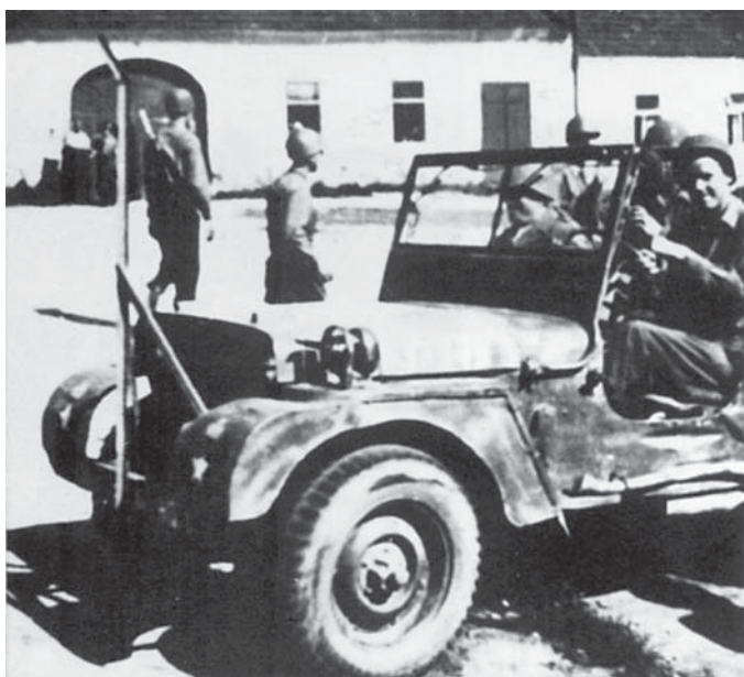
Příjezd prvních amerických jeepu do Křemže.

V úterý 8. 5. a další dny byl už klid. Ve středu jsme se dozvěděli, že Německo podepsalo konečnou kapitulaci a tím válka skončila. 10. 5. přijížděli do Křemže další jeepy a nákladní auta US army. Naše obyvatelstvo je nadšeně vítalo. Večer byla na faře pro velitele a vojáky amerických jednotek za přítomnosti Revolučního národního výboru uspořádána veselá hostina.