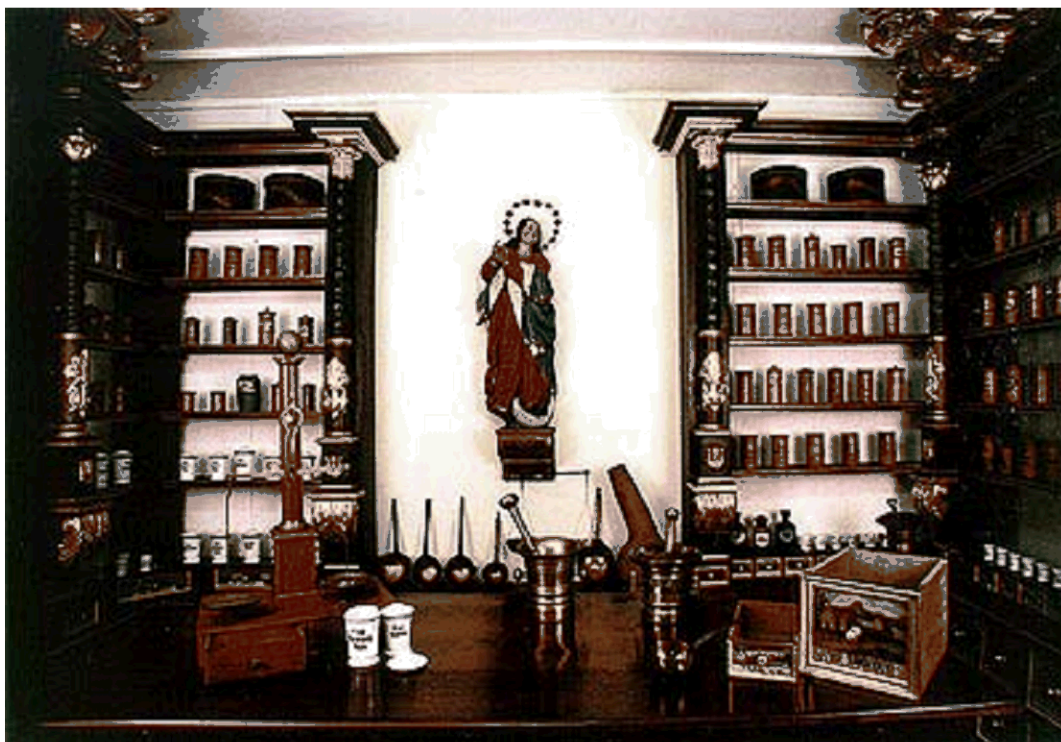
Barokní „apatyka“ ve stálé muzejní expozici.

Existence jezuitské lékárny je ve městě spjata s činností jezuitského řádu, neboť se původně nacházela v komplexu budov jezuitské koleje v Horní ulici (č. p. 154), kterou dal v letech 1586 - 1588 postavit Vilém z Rožmberka podle plánů italského stavitele Baldassara Maggiho z Arogna. První dochovaná písemná zpráva o jezuitské lékárně pochází z roku 1640 , a proto lze její činnost předpokládat již po roce 1600, neboť přesný rok jejího vzniku není zcela jistý. Po zrušení jezuitského řádu v roce 1773 byl celý soubor lékárny odkoupen Schwarzenberky za 3000 zlatých a přenesen na českokrumlovský zámek, i když ji chtěla také získat městská rada coby městskou lékárnou. Jelikož o služby této lékárny na zámku nebyl mezi obyvateli města přílišný zájem, bylo její zařízení přestěhováno do tzv. Románské komory, kde se tehdy nacházela sbírka pozoruhodných památek a kuriozit. Do fondu českokrumlovského muzea se dostalo zařízení barokní lékárny v roce 1952 jako ojediněle dochovaný soubor.